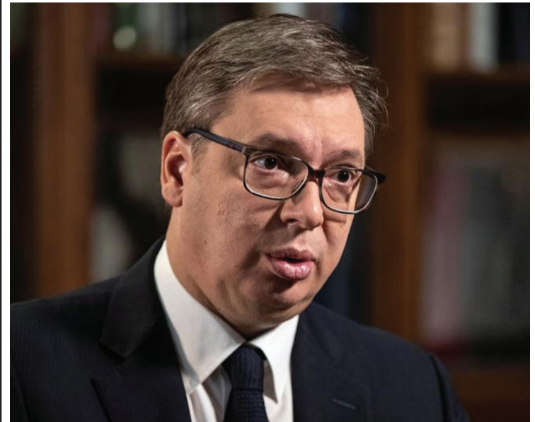
الرئيس الصربي ألكسندر فولين

أنه هو الآخر معرض للتصفية والاعتقال من طرف هذه العصابات، وصرح في هذا الخصوص قائلاً: «أمن الرئيس فوسيتش في خطر، وكل من هؤلاء المسؤولين عن المخدرات يعلمون أنه في حالة مقتل وزير الداخلية، فسيتم استبداله من خلال البرلمان في غضون شهر أو شهرين. أما إذا قتلوا ألكسندر فوسيتش فسيفتلون شخصاً سياسياً يضمن الاستقرار السياسي لصربيا ويوحد غالبية الرعايا السياسيين من حوله، وغالبية المواطنين الصرب يتقنون به ثقة مطلقة».